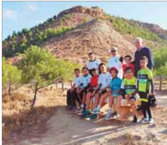
Alto en la ruta para reponer fuerzas con la entrega de 'pan preñado', fruta y agua en el avituallamiento de Cuatro Cantos. /NR