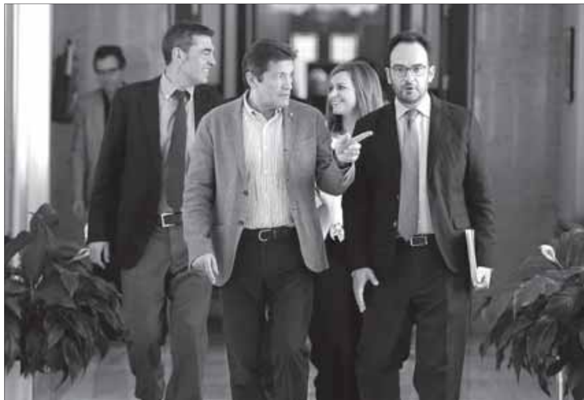
El presidente de la gestora del PSOE, Javier Fernández (c), conversa con el portavoz en el Congreso, Antonio Hernando.

Casi todos los parlamentarios progresistas son partidarios de buscar una salida dialogada con el resto de las formaciones para llegar a un acuerdo y evitar una nueva cita con las urnas