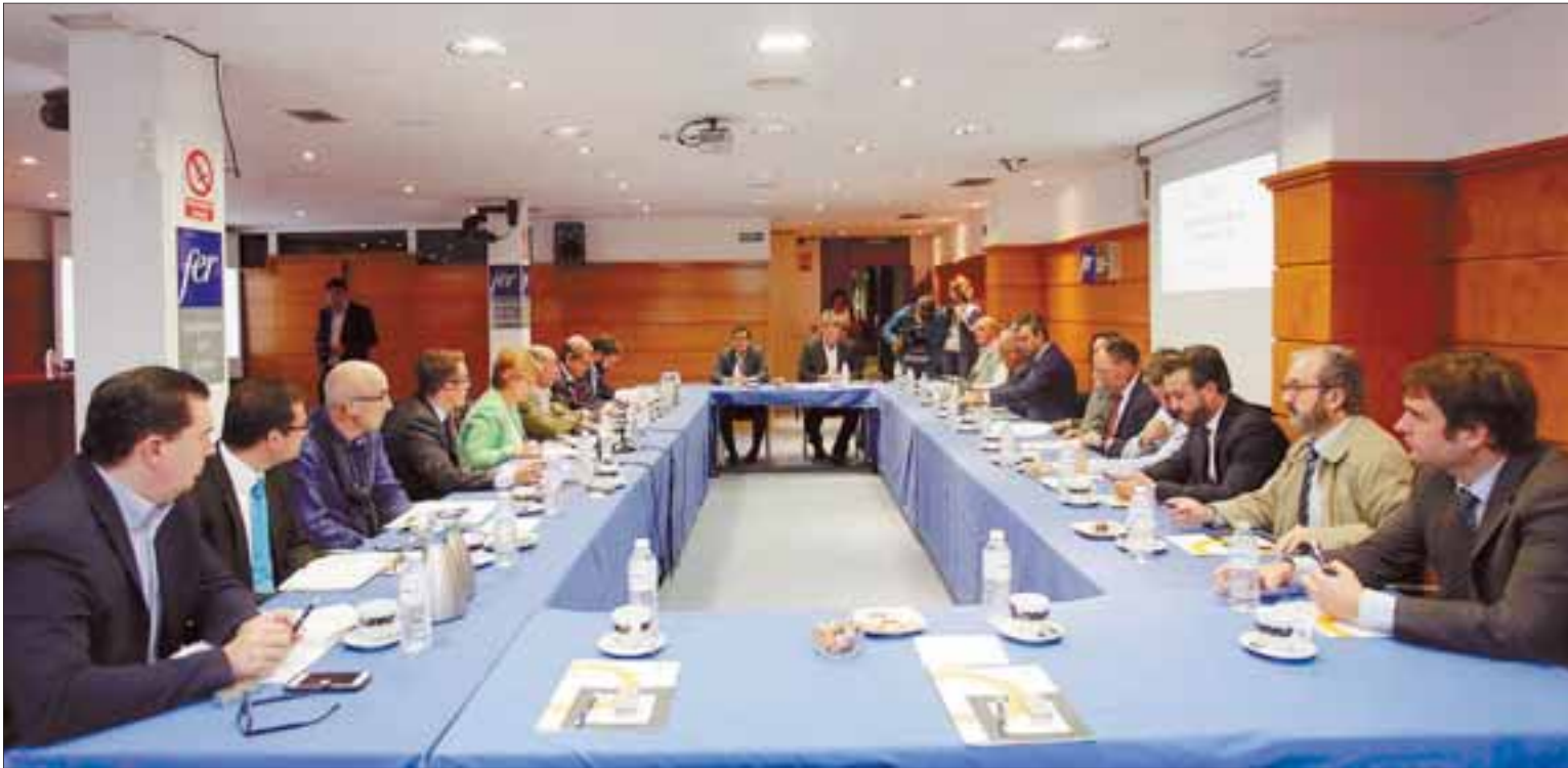
Reunión celebrada ayer en el salón de actos de la FER, donde se presentaron las conclusiones del Inobarómetro 2016. /INGRID

C/ Portales, 1 - Logroño. Teléfono 941 252 105