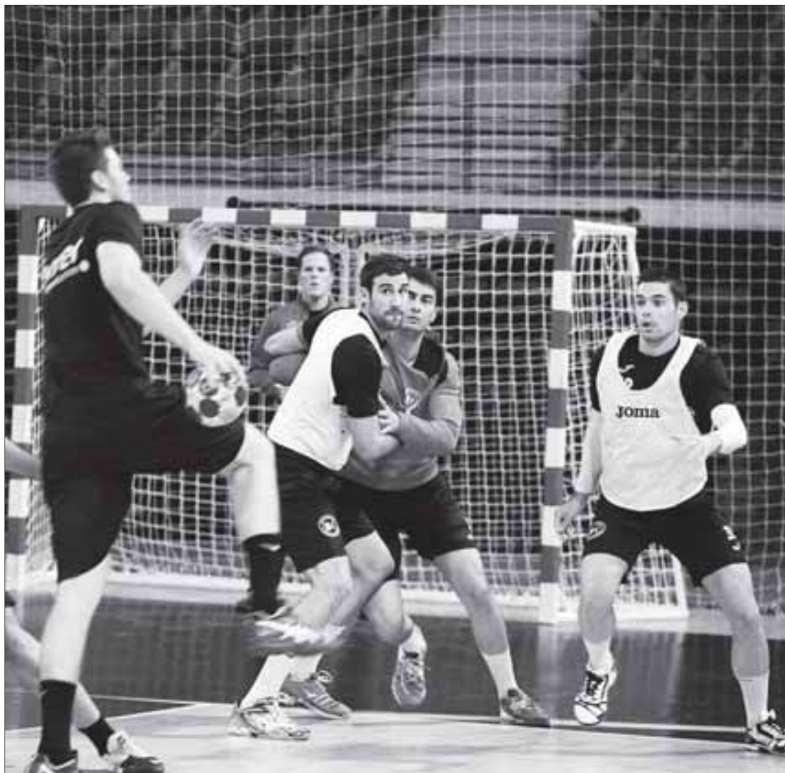
El Naturhouse abre hoy en Sagunto la sexta jornada de la Asobal.