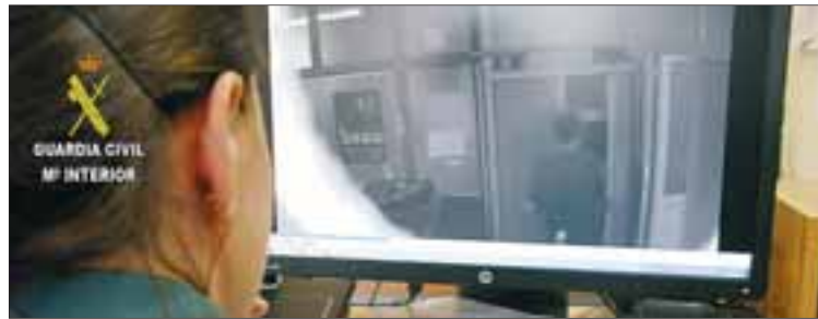
Una agente observa la grabación en la que se ve al detenido.

El hombre arrestado, de 42 años, nacionalidad española, vecino de Arnedo y con un amplio historial delictivo, está acusado de apropiarse, presuntamente, de 590 euros, sustraídos en las oficinas municipales de Quel durante los días 16, 24, 25, 26, 29 y 30 del pasado mes de agosto, según detallaron ayer fuentes del instituto armado.