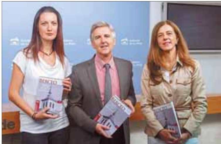
Presentación del número 170 de la revista 'Berceo'.