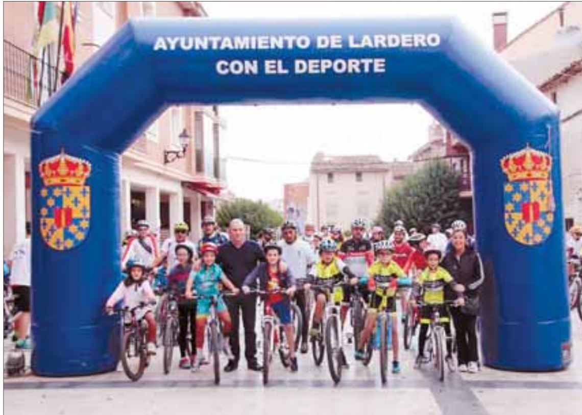
Salida desde la Plaza de España con la participación de más de 150 inscritos de todas las edades. /NR

El regreso, sobre la una de la tarde, al mismo punto de partida sin ningún accidente.