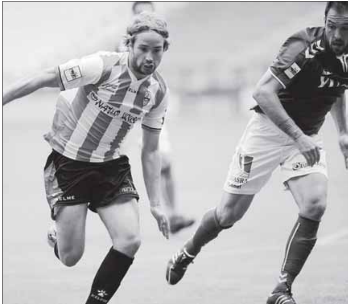
Mendi, en pleno esfuerzo en el partido disputado en Las Gaunas frente al Socuéllamos.

De eso se trata. Jugar bien en Barakaldo para ir hacia arriba.