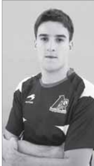
Jaunarena. / ASPEPELOTA.COM

El delantero de Amezketa, el gran triunfador del verano, no tuvo un día feliz y se quedó en trece tantos.