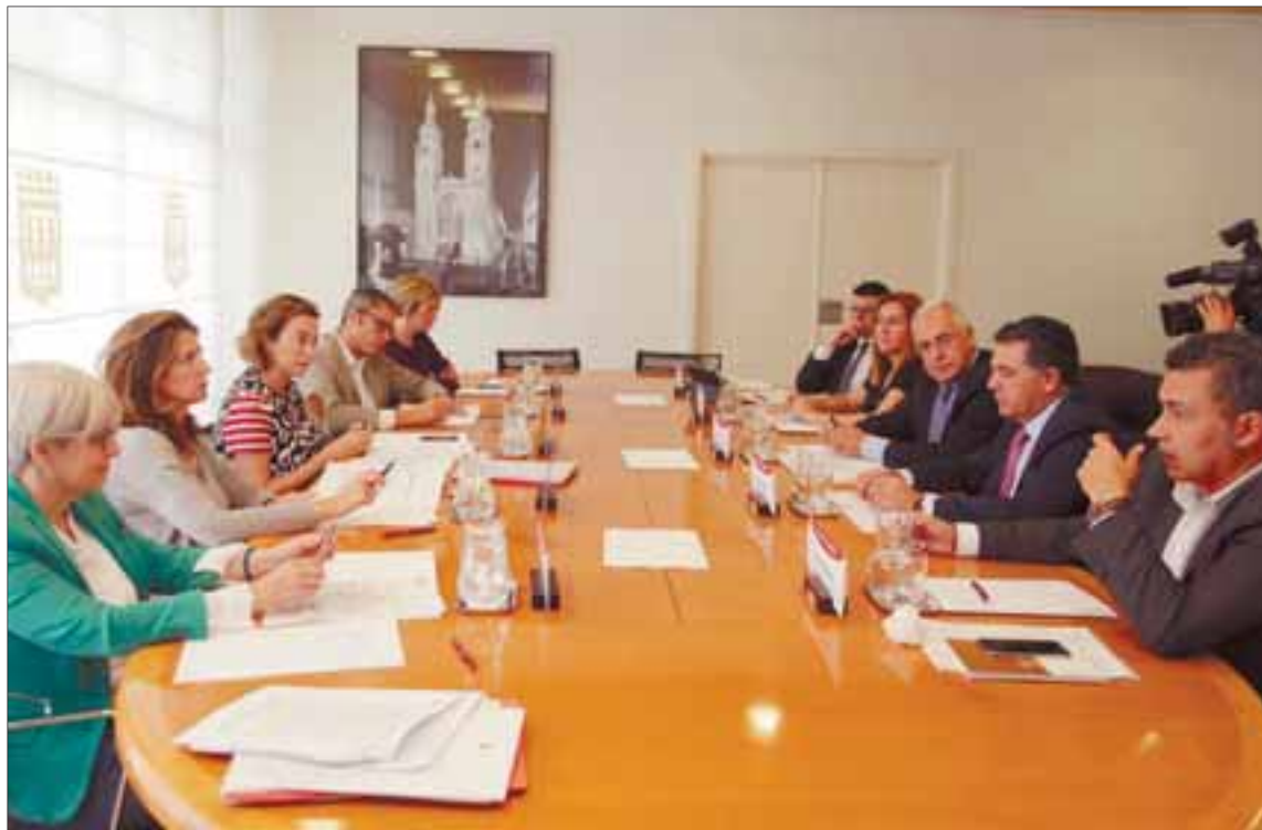
Representantes del Ayuntamiento de Logroño y del Gobierno de La Rioja, en la reunión del Consejo de Capitalidad. /INGRID

El presidente regional señaló que «hemos conseguido establecer un marco estable de colaboración que se refiere a áreas tan dispares como servicios sociales, educación, urbanismo, transportes, comercio, vivienda, bomberos, cultura o infraestructuras».