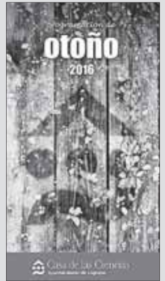
Cartel de la programación otoñal.

en la que también se propone aumentar a diez minutos, de lunes a sábado, las frecuencias de las líneas 1 -de Lardero al Hospital San Pedro-, 4 -de Riojaforum a Pradoviejo- y 5 -de Madre de Dios a Valdegastea-.