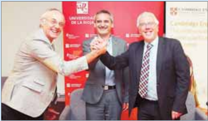
El rector de la UR (centro), con los representantes de la entidad británica.