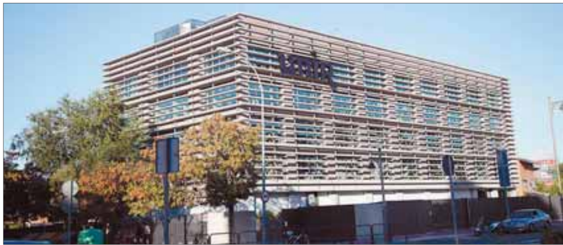
El nuevo edificio de la Universidad Internacional de La Rioja está situado en el número 137 de Avenida de la Paz.

Con ello, como explicaron desde la UNIR, con esta infraestructura acogen todas las dependencias y servicios de la universidad