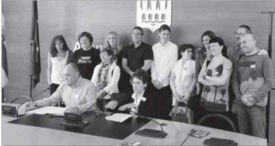
Representantes de los grupos de la oposición con miembros de la Plataforma Bienvenidos Refugiados de La Rioja. /NR

Además, el Grupo Socialista instó al Gobierno riojano a que resuelva con «inmediatez» las ayudas al comedor escolar para este curso, con las que el Ayuntamiento de Logroño colabora con 130.000 euros para que las familias logroñesas puedan afrontar el pago de este servicio.