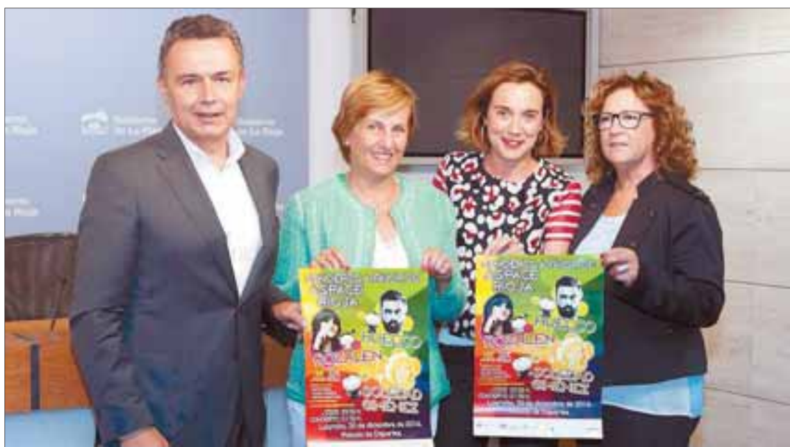
Presentación ayer del concierto benéfico a favor de Aspace Rioja, que tendrá lugar en el Palacio de los Deportes.