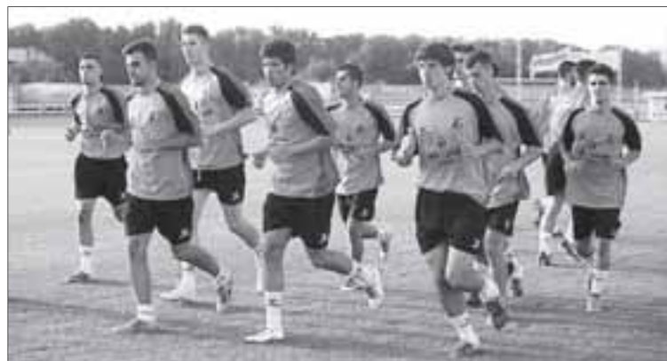
El Varea, uno de los finalistas de la Copa Federación.

Será el próximo miércoles, Fiestividad de la Hispanidad, en el Mundial 82, a partir de las 17.30 horas. El Haro, tras su tímido arranque, sueña con el título conseguido en la 2014-15. El Varea, tras eliminar a la SDL en semifinales, quiere volver a dar la campanada.