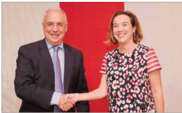
Ceniceros y Gamarra rubrican el convenio de capitalidad.

Hizo hincapié en el desarrollo de la Agenda para la Población que lidera el Gobierno regional y en la que Logroño quiere participar para afrontar el reto que se ha marcado atendiendo al envejecimiento de la población. Otra de las acciones conjuntas fijadas como prioritarias es la planificación de las infraestructuras sanitarias y educativas en Logroño.