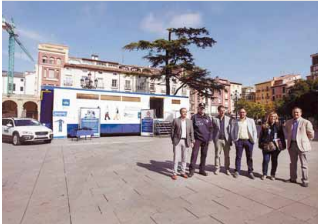
El concejal de Seguridad Ciudadana, con representantes de la organización de la campaña, ayer en la Plaza del Mercado.

Desde UGT hacemos un llamamiento en defensa de la profesión e instamos a los gobiernos a adoptar medidas concretas para que la educación tenga un lugar prioritario. La incertidumbre en la política y en la educación nos hace reivindicar más que nunca que la labor de los docentes es imprescindible para transformar la realidad.