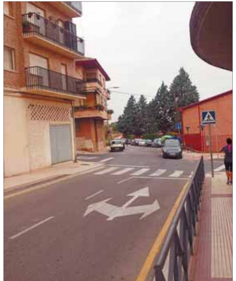
El Camino Viejo de Logroño es una de las calzadas que va mejorando su firme. /NR

cedimiento abierto, con la participación de 9 empresas que han presentado sus ofertas. La adjudicataria por la mesa de contratación la empresa riojana Lázaro Conextrán S.L. por ser la oferta más ventajosa, comprometiéndose a llevar a cabo las obras proyectadas en 134.913,79 euros.